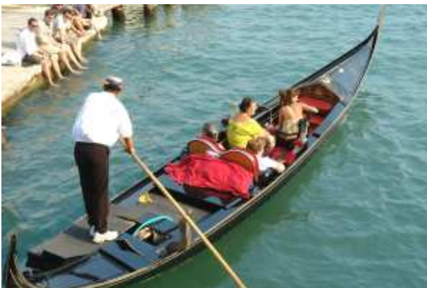
Gondel am Canal Grande