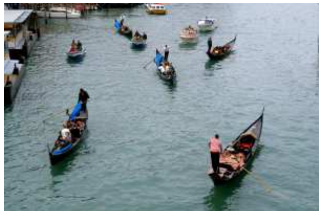
Canal Grande mit Gondeln

Insellage Wie Sie sicher schon gehört haben, ist Venedig eine Ansammlung von vielen kleinen Inseln, die mitten in der Lagune der nördliche Adria liegen. Wegen dieser Insellage wird seit alters her ein Grossteil der Menschen, Lebensmittel und Materialien mit Booten (Vaporettos) bzw. Gondeln transportiert.