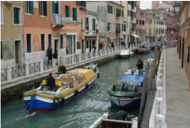
Kleine Kanäle und Gassen