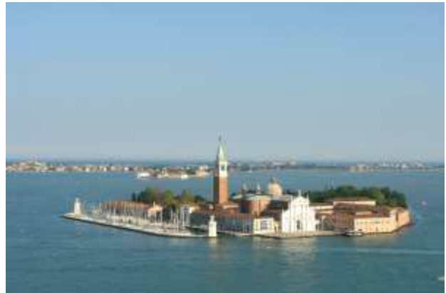
San Giorgio Maggiore