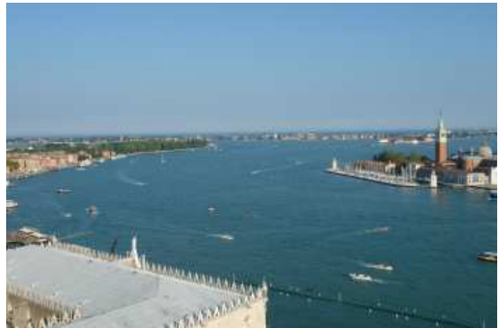
Dogenpalast von oben. Im Hintergrund der Lido