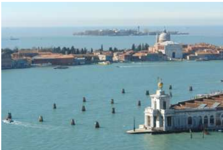
Blick vom Campanile