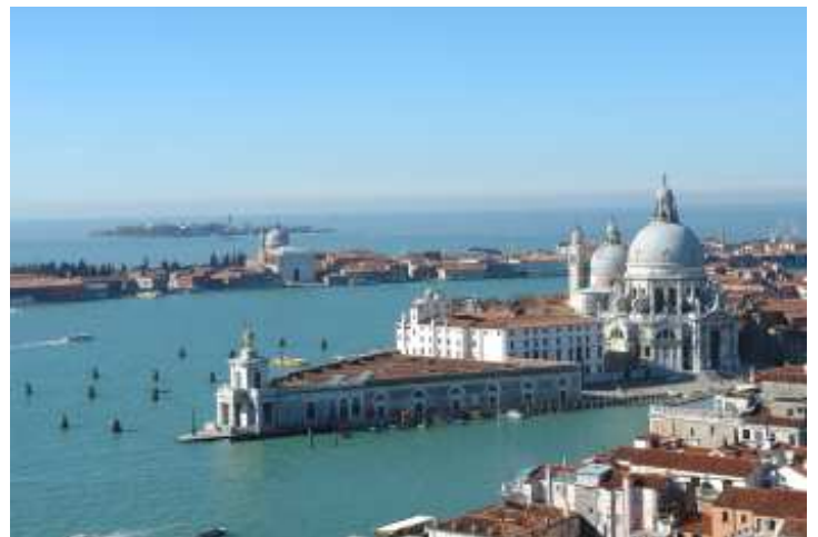
Blick vom Campanile auf La Salute