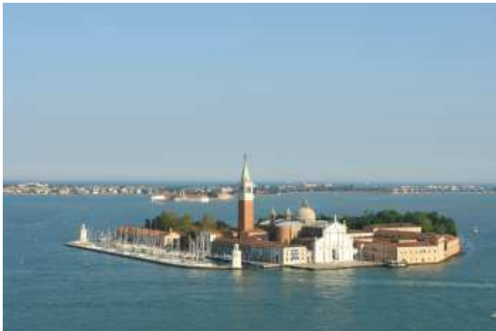
San Giorgio Maggiore